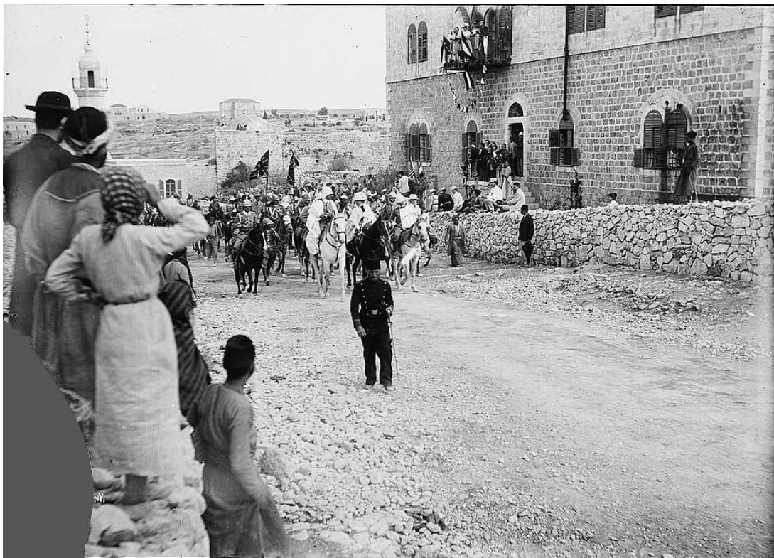
Figuur 2: De intochten in Jeruzalem van Wilhem II (1898)