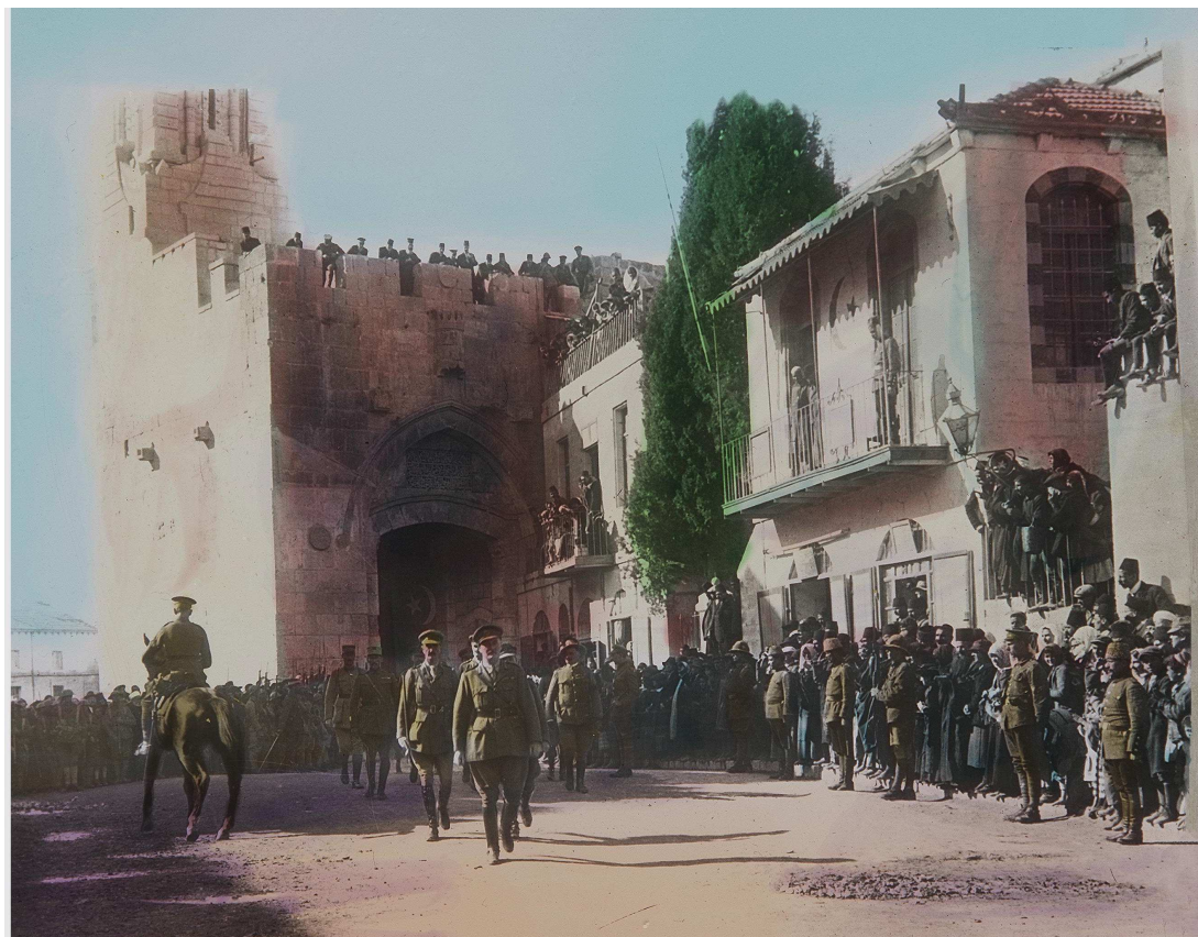
Figuur 3: De intochten in Jeruzalem van Maarschalk Allenby (1917)