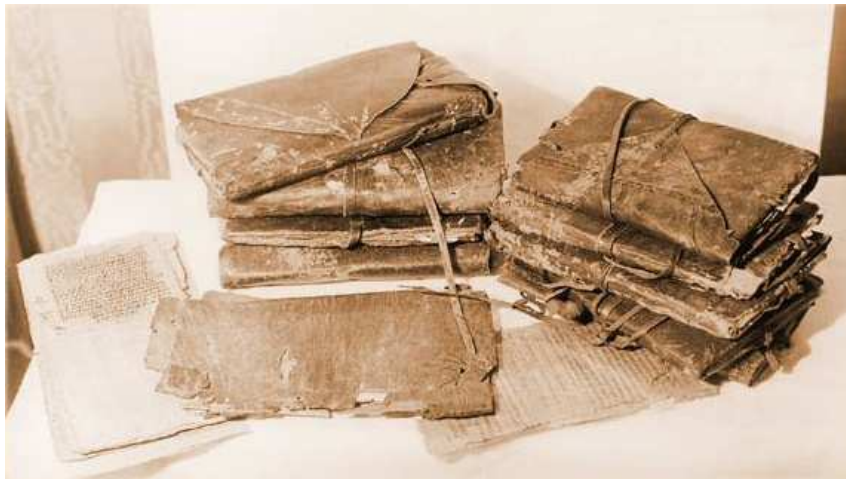
Figuur 2: gnostic gospels