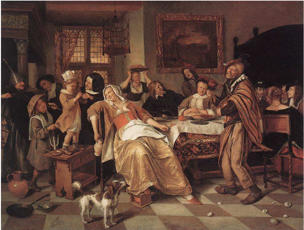
Figuur 2: Het Driekoningenfeest, Jan Steen